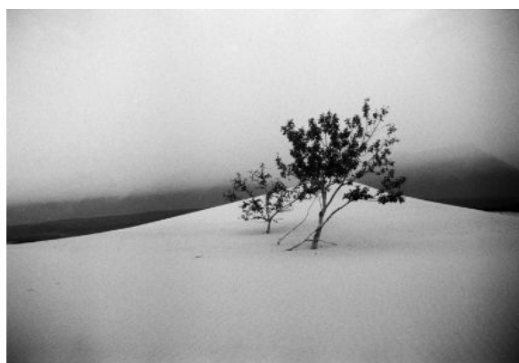
Джон Р. Пеппер, Пустыня Руб-эль-Хали, Оман, ОАЭ, камера Leica M6, объектив 35мм, черно-белая пленка Ilford HP5