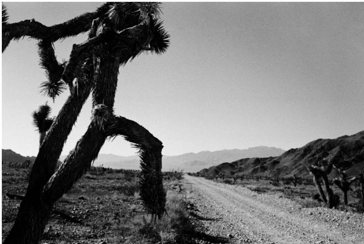
Джон Р. Пеппер, Пустыня Невада, США, камера Leica M6, объектив 35мм, черно-белая пленка Ilford HP5