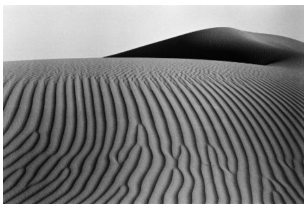
Джон Р. Пеппер, Пустыня Руб-эль-Хали, Оман, ОАЭ, камера Leica M6, объектив 35мм, черно-белая пленка Ilford HP5